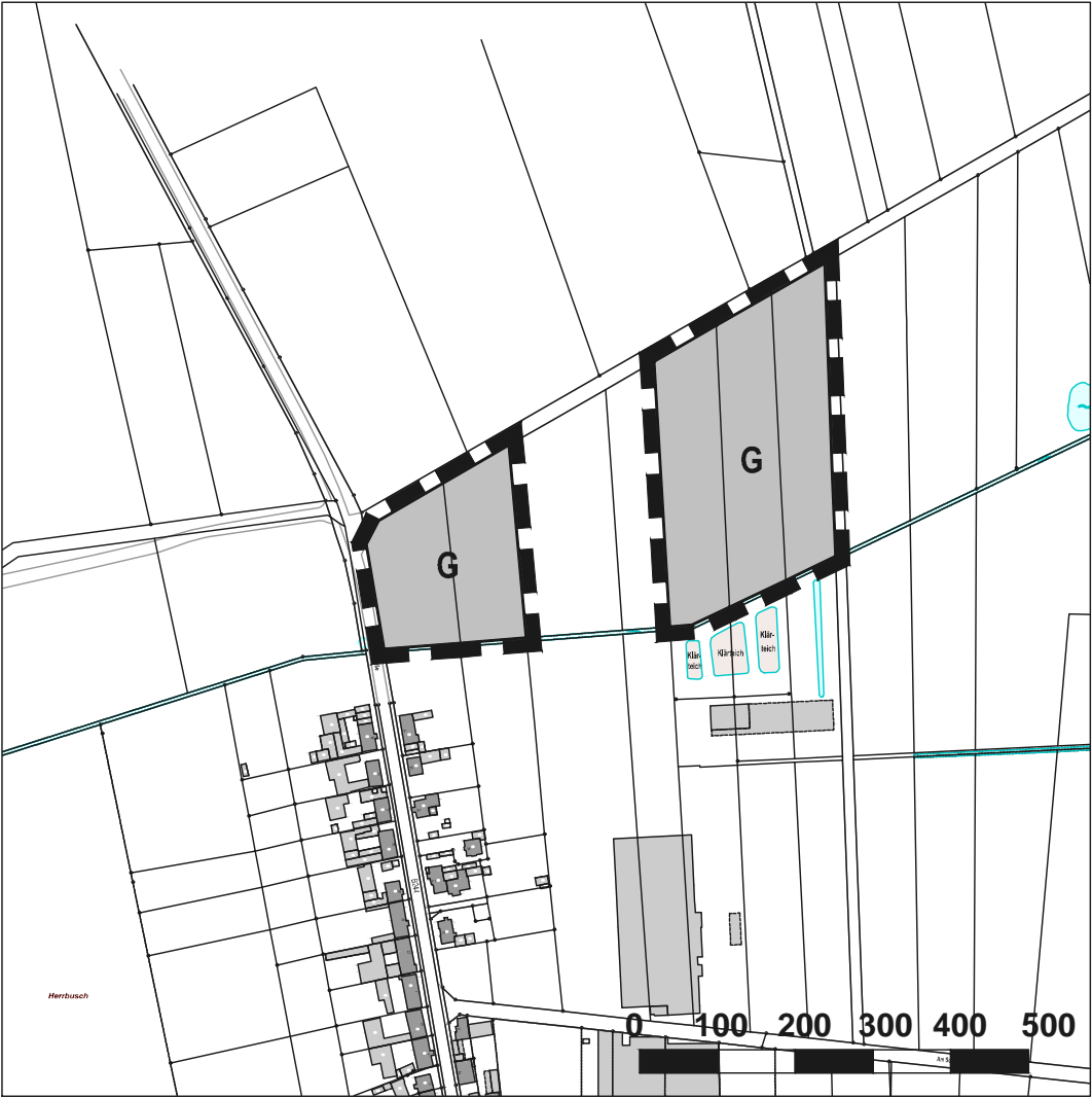
Kartengrundlage: Amtliches Liegenschaftskatasterinformationssystem Stand: 2019