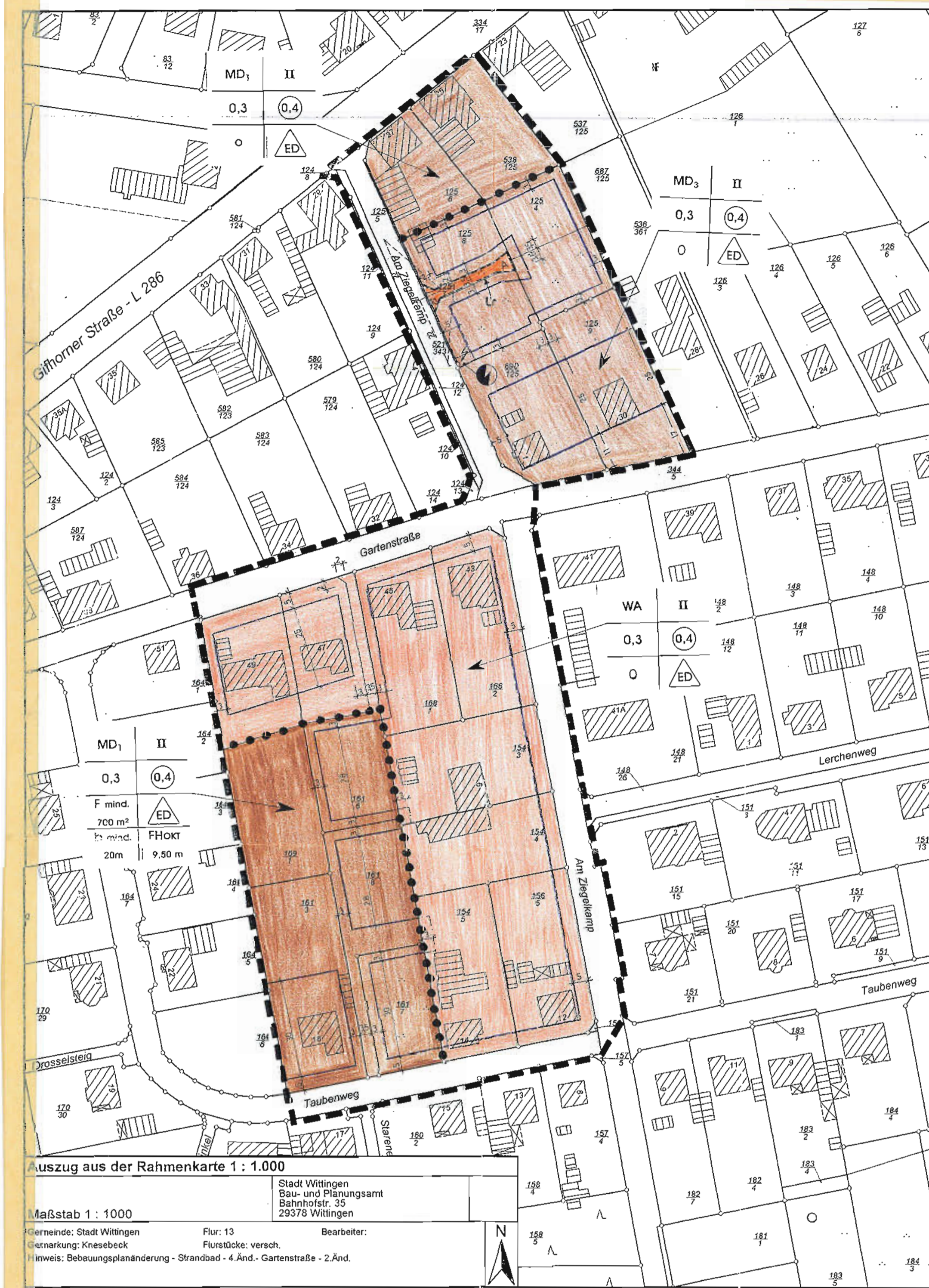
Auszug aus der Rahmenkarte 1 : 1.000

Stadt Wittingen Bau- und Planungsamt Bahnhofstr. 35 29378 Wittingen Flur: 13 Flurstücke: versch. Flurstück: versch. Maßstab 1 : 1000