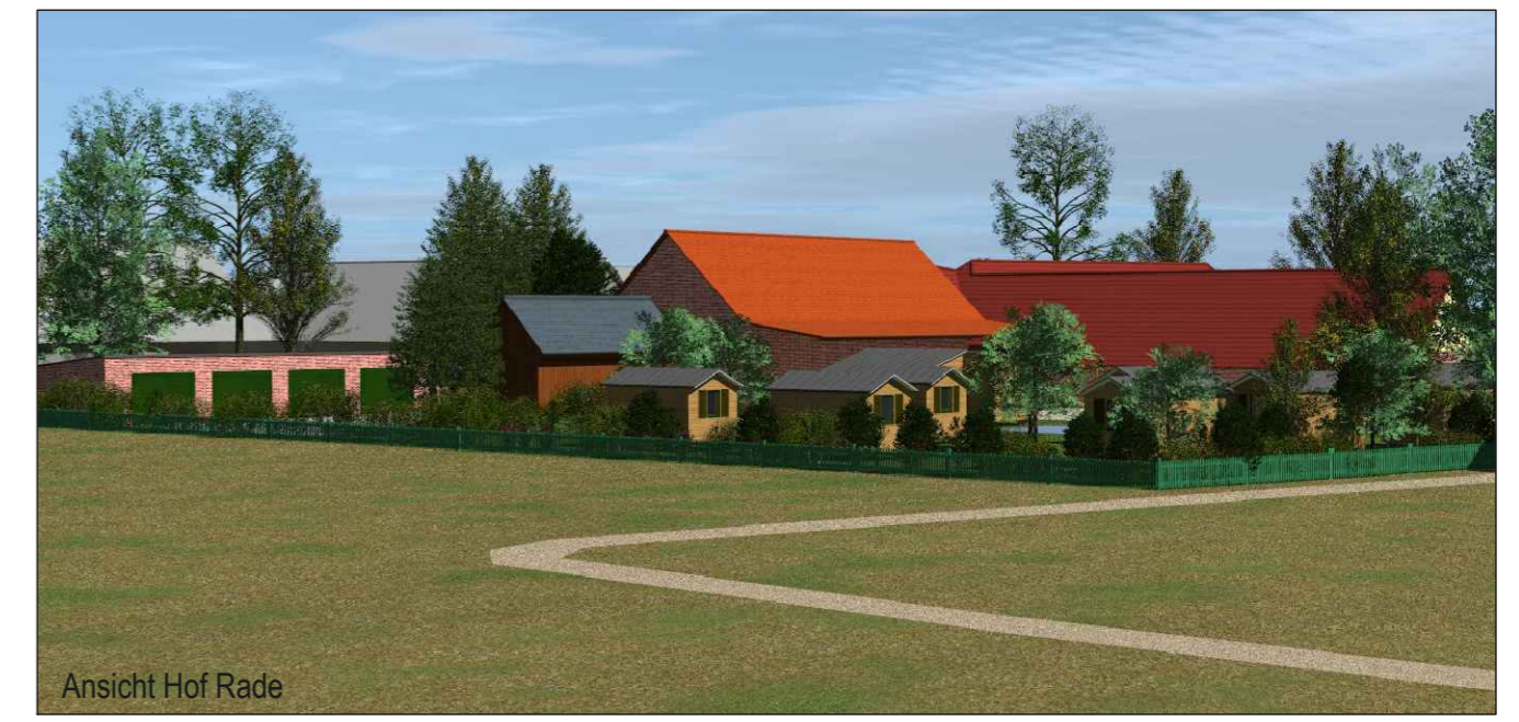
Ansicht Hof Rade